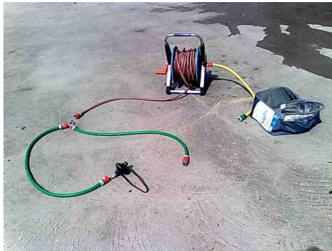
Présentation du matériel.