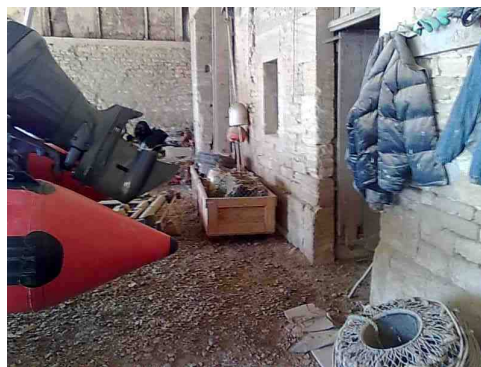
Sans la bâche (ne pas laisser à poste la bâche bleue du poste du pilote) avec passage à l'arrière pour les indigènes.