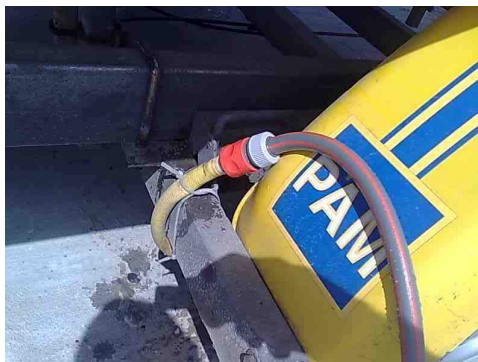
Branchement et rinçage des freins de la remorque (2 minutes). Le robinet de la cale de Courseulles est à coté des pompes à essence.