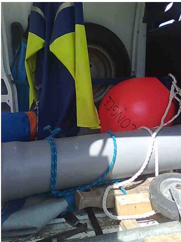
Proposition de rangement intérieur.