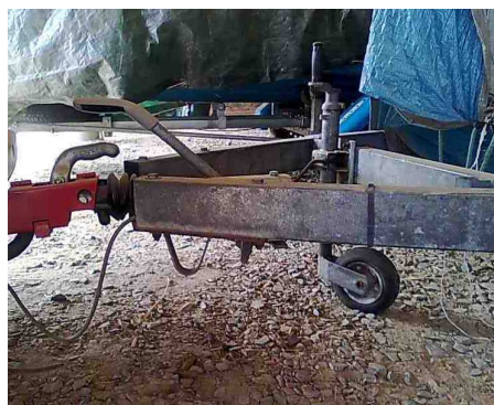
Bâché, frein de remorque non mis, roue jockey positionnée pour soulager les amortisseurs du Jumpy